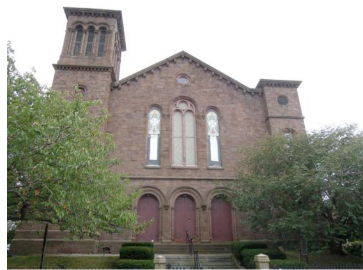
傑奎琳和肯尼迪結婚的教堂

她去世多年，美國人至今還在懷念她。我有個朋友說，她不過是運氣好，出生在特富裕的家庭，才有後來一系列的機會，如果生在西弗吉尼亞礦工家裏，長得再漂亮又沒有用。沒有好家庭提供給你的特殊資源，你根本就沒有出人頭地的機會。我點頭同意帕特的觀點，如果她是普通家庭的女孩，不可能跟肯尼迪邂逅，就是邂逅了，也不過擦肩而過，很難撞出相應的火花。肯尼迪是個有野心的政治家，而政治意識總是伴隨階層認知。